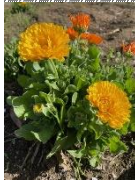
泰平山のたんぽぽ