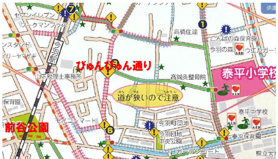
【ヒヤリハットマップより】